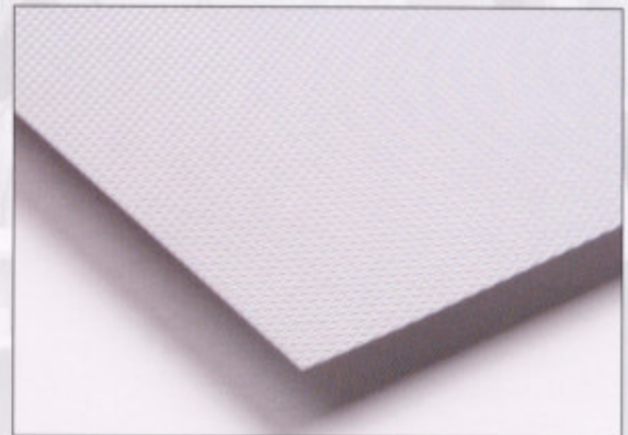
AGO-System Einlegeplatte · AGO-System insert shelf

Besides the extruded version, we also offer the AGO-System as a cut-to-size board which makes it easy to clean and replace. We can supply the boards cut to customer-specified dimensions or as a standard board in the following sizes: 2100 x 500 or 2100 x 750 mm Contours can be created using modern cutting tools. Fixed dimensions and colours on request.